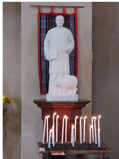
Nassogne, traces du passé, hommage du présent